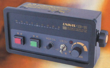
コントロールユニット ED-12