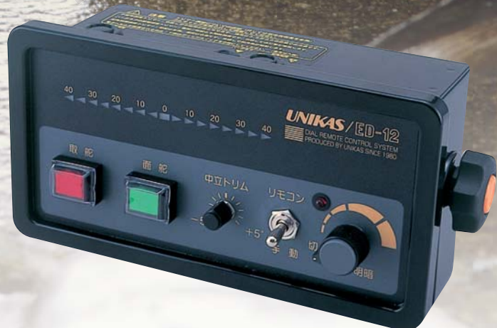
コントロールユニット ED-12